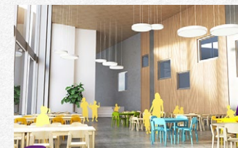
Matsalar med härlig rymd.

Skolan omfattar 16 000 kvm och är klara i juni 2020. Tack vare separata ingångar och avdelade lokaler skapas många mindre skolor i en trygg miljö. Totalt finns plats för 1 000 elever från förskoleklass till åk 9. Även särskolan integreras.