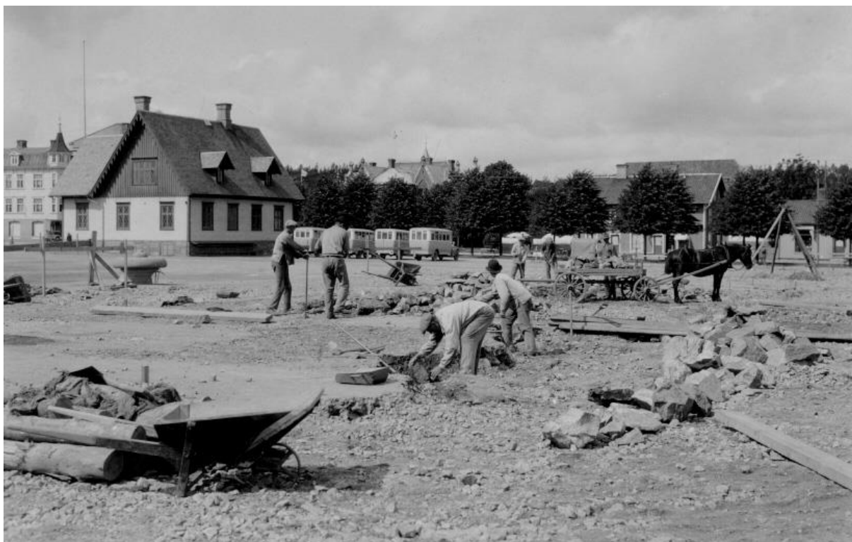
Östra delen av torget mot Kungsgatan med Torggatan till vänster.

Så här såg det ut 6 augusti 1929 när torget iordningställdes.