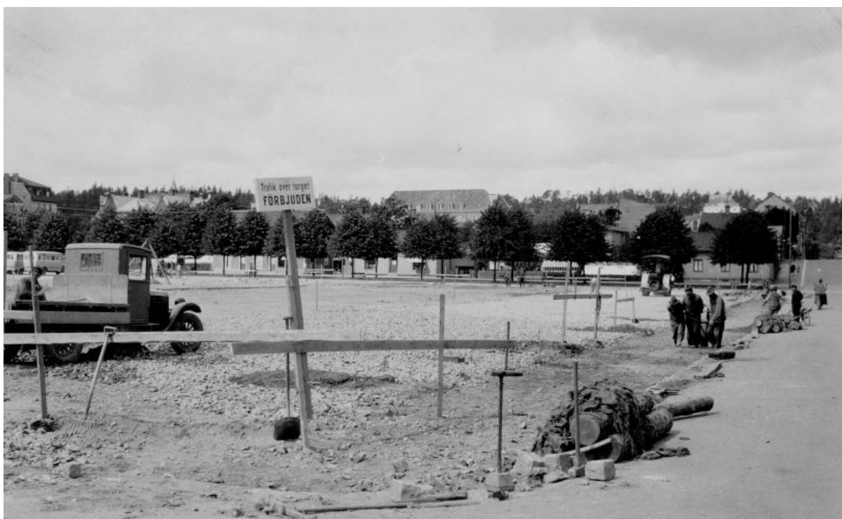
Östra delen av torget mot Kungsgatan med Föreningsgatan till höger.