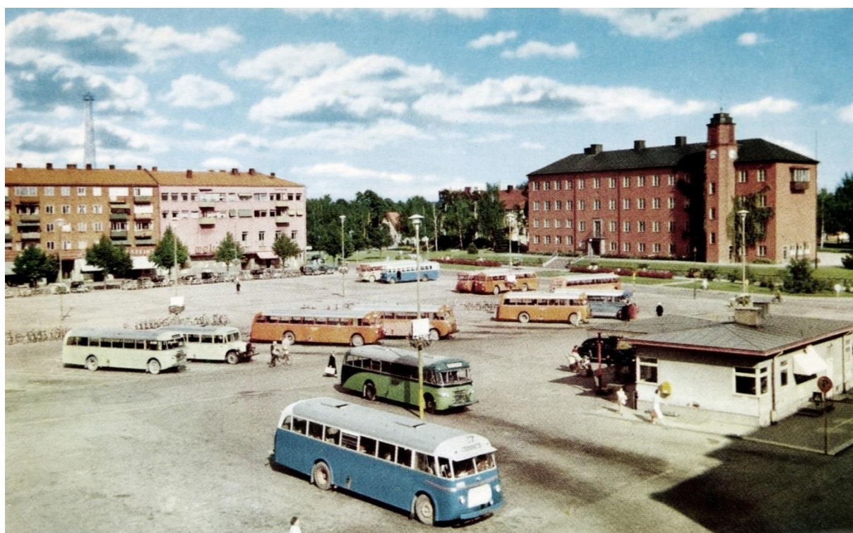
Vy över Trollhättan med Drottningtorget och läroverket år 1954. Foto från Walter Göranssons bildsamling. Bild nr TBWG-003-105a, Innovatums bildarkiv.