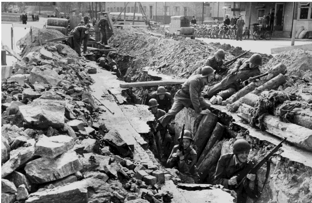
Hemvärnsövning på Drottningtorget våren 1944. I bakgrunden syns tingshuset (färdigt år 1938) i kvarteret Älvkvarnen och till höger kvarteret Toppön.