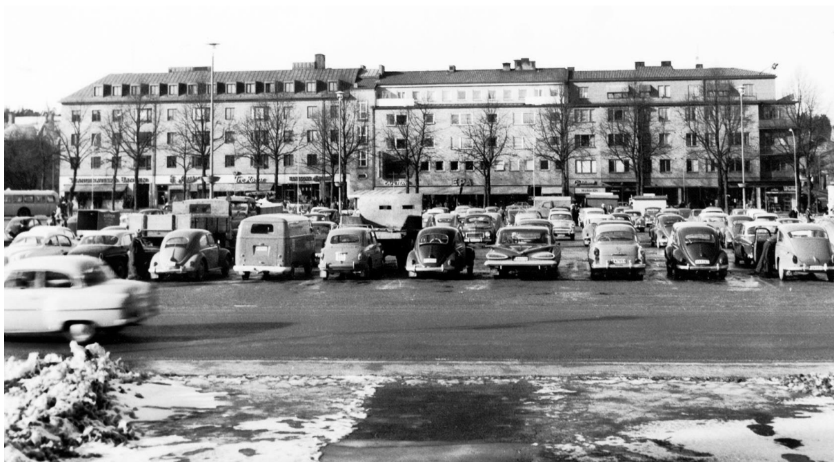
Parkerade bilar på Drottningtorget i februari 1962. Kvarteret Diana i bakgrunden.