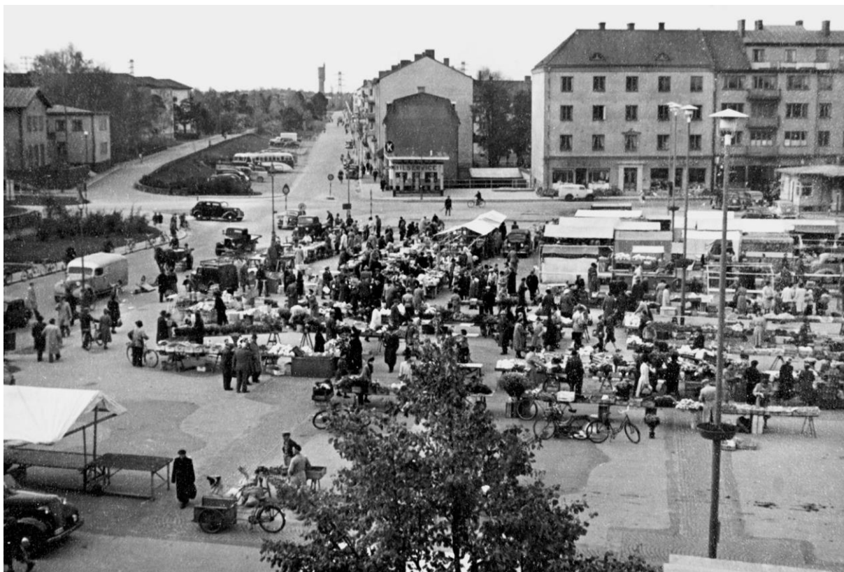
Drottningtorget i korsningen av Drottninggatan, Torggatan och Gärdhems- vägen år 1950. Till vänster i bild syns tingshuset (som stod klart år 1938) i kvarteret Älvkvarnen och till höger kvarteret Toppön. Bild nr TB-150-045, Innovatums bildarkiv.