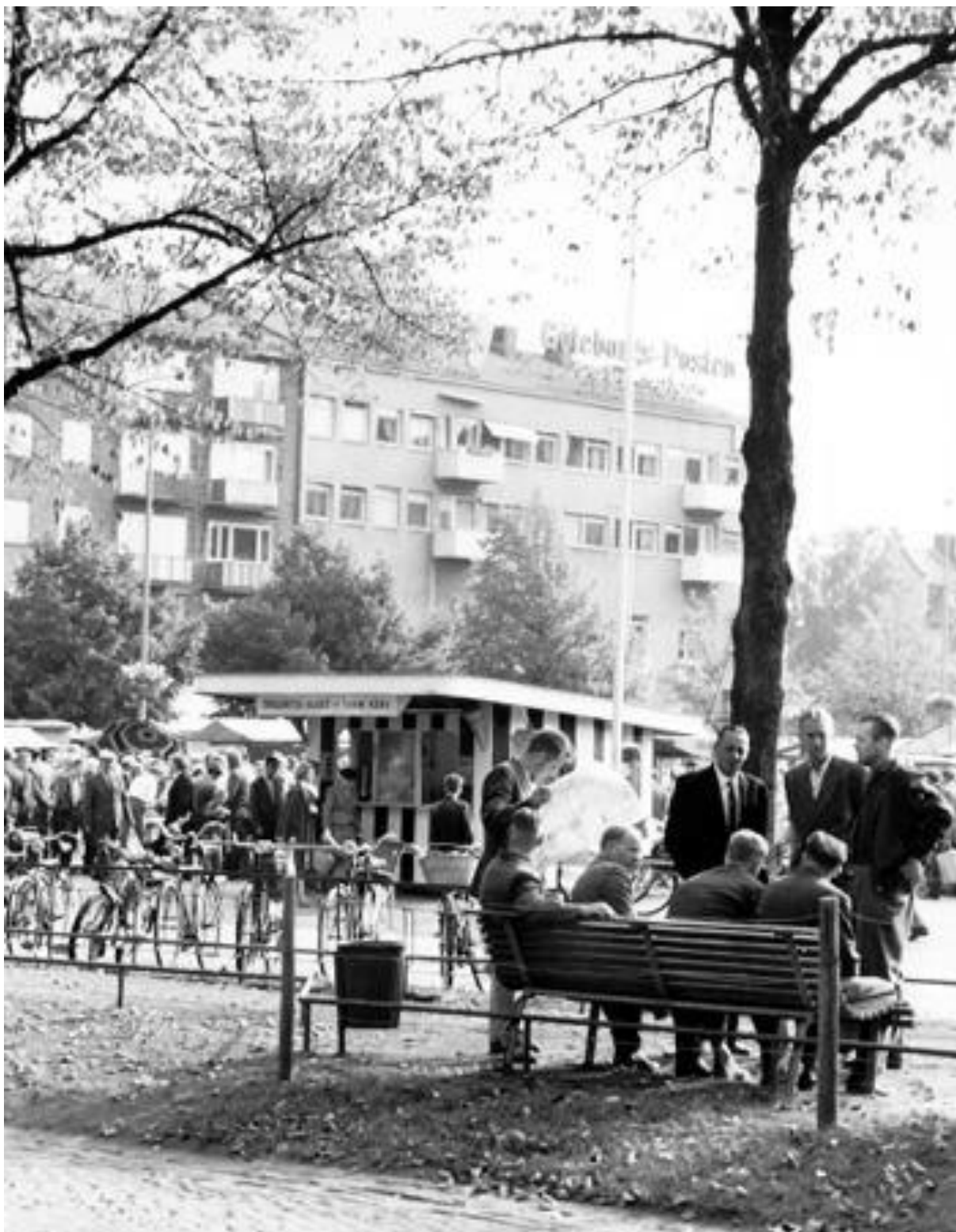
Allén med glass- och korvkiosken på Drottningtorget på femtiotalet. I bakgrunden kvarteret Tor.