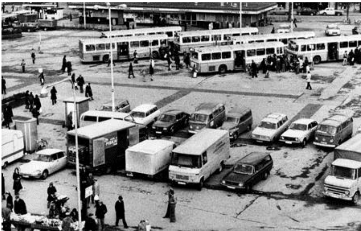
Drottningtorget i slutet av 1980-talet. Bild nr TB-150-094, Innovatums bildarkiv.