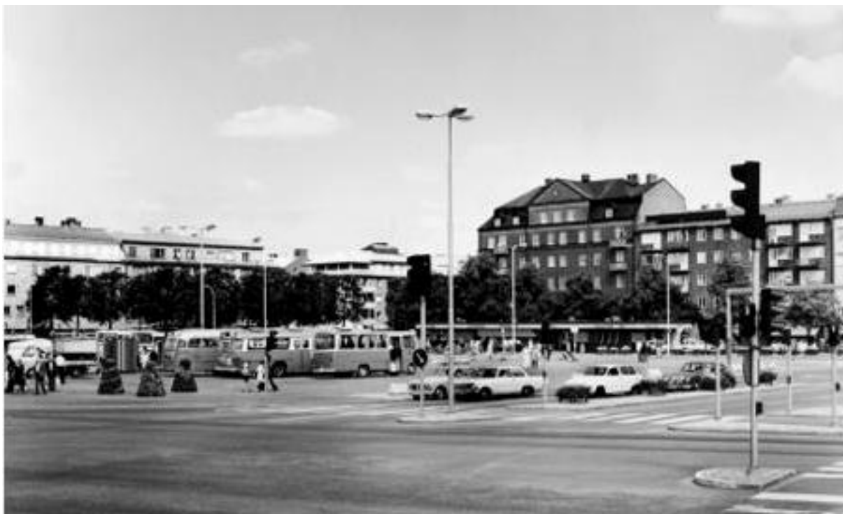
Korsningen av Drottninggatan och Torggatan vid Drottningtorget i juli 1975. I bakgrunden kvarteret Diana, kvarteret Venus och kvarteret Tor. Bild nr TB-150-089, Innovatums bildarkiv.