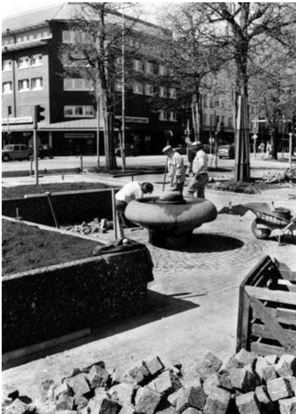
Ombyggnaden av Drottningtorget i maj 1985. I bakgrunden Kapp-Ahl i Engelska hörnet. Till höger på andra sidan Torggatan skymtar Polhemsplatsen.

Bild nr TB-150-127, Innovatums bildarkiv.