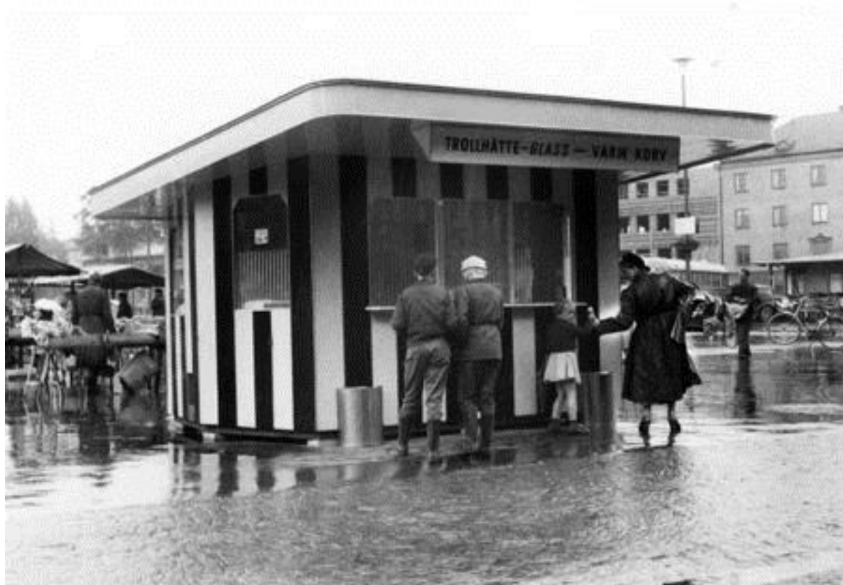
Glass- och korvkiosken på Drottningtorget cirka 1954. Bild nr TB-150-060