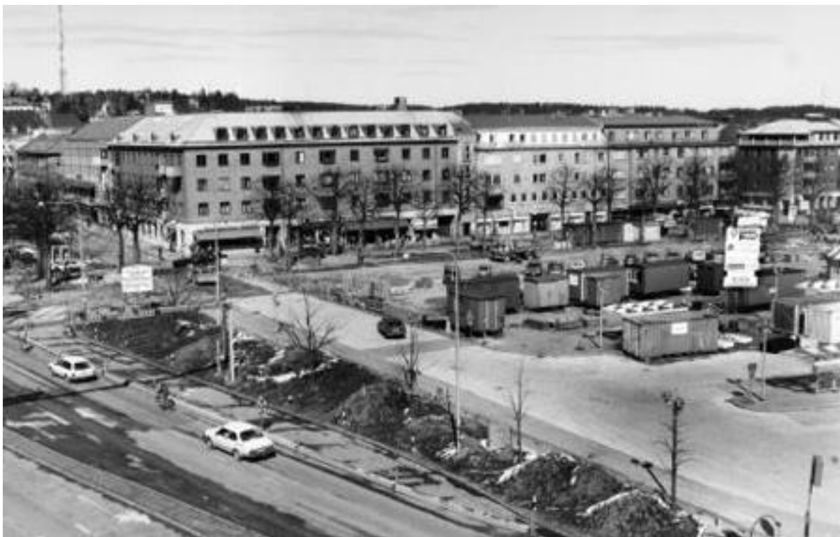
Ombyggnad av Drottningtorget i mars 1985. I bakgrunden kvarteret Diana med Skandinaviska Banken och Tempo. Bild nr TB-150-125, Innovatums bildarkiv.