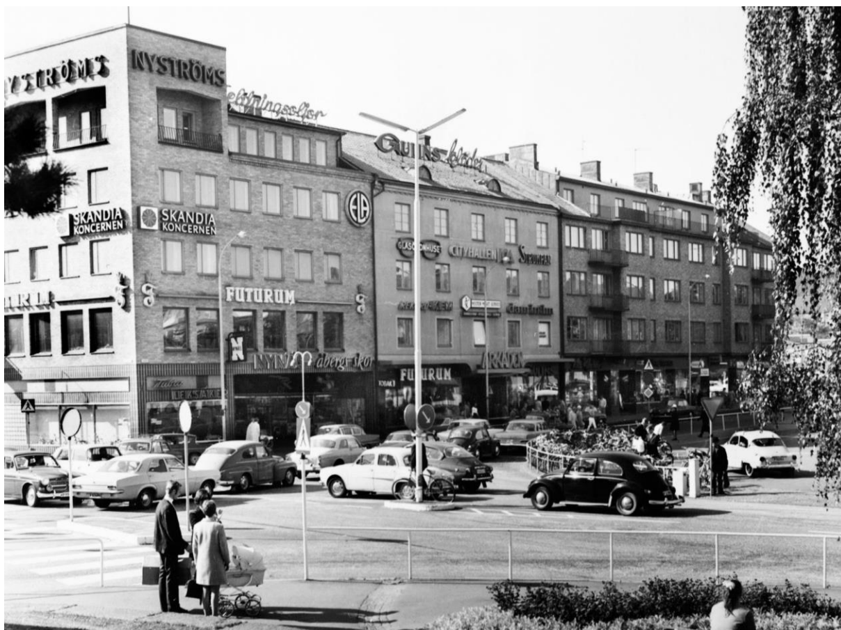
Nyströms hörna i korsningen av Drottninggatan och Torggatan. Foto Sven Stertman i september 1969. Bild nr TB-301-004, Innovatums bildarkiv.