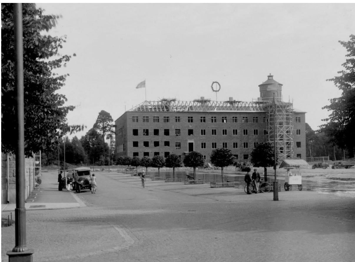
Läroverket under uppbyggnad år 1935. Skolan stod färdig år 1936.