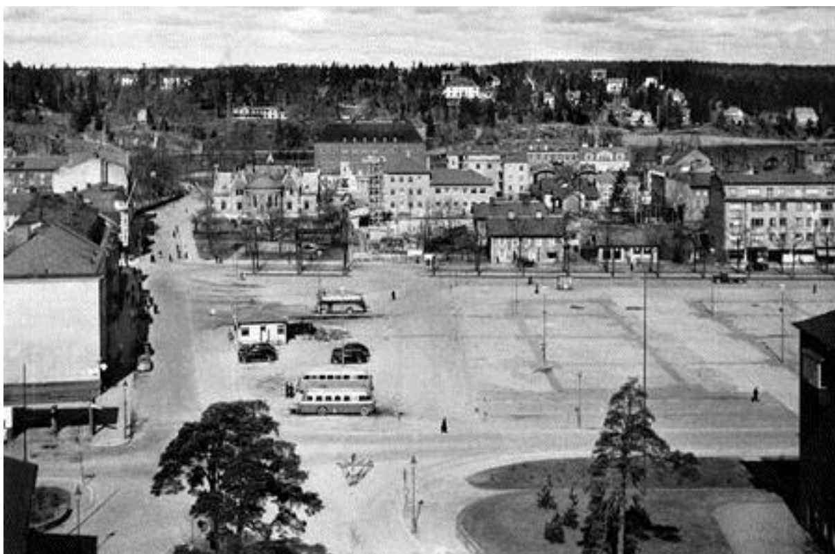
Drottningtorget år 1947. Bild nr TB-147-068, Innovatums bildarkiv.