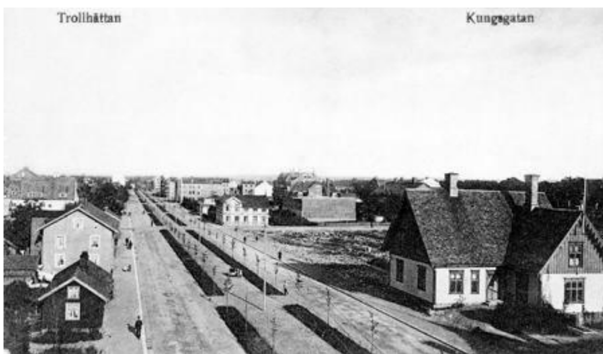
Kungsgatan med nyplanterad lindallé. Till vänster Ostebons hus i kvarteret Diana och doktor Axel Hellebergs fastighet i kvarteret Venus vid Föreningsgatan. Till höger flickslöjdskolan, pensionatet Savoy (tidigare Fischerströmska huset som byggdes år 1899) och ett nybyggt varmbadhus. Foto år 1911. Bild nr TB-091-033, Innovatums bildarkiv.

Bild nr TB-091-040, Innovatums bildarkiv.