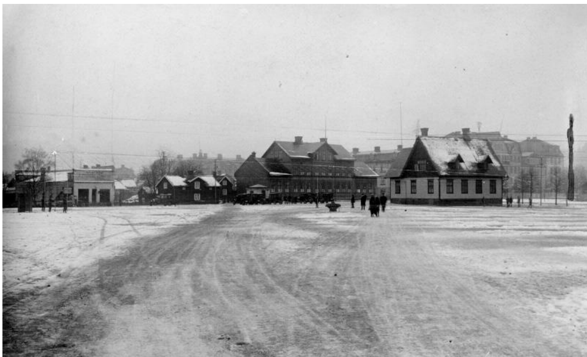
Södra delen av torget mot Torggatan med samrealskolan och flickslöjdskolan till höger.

Nedanstående bilder från Innovatums bildarkiv är tagna år 1927.