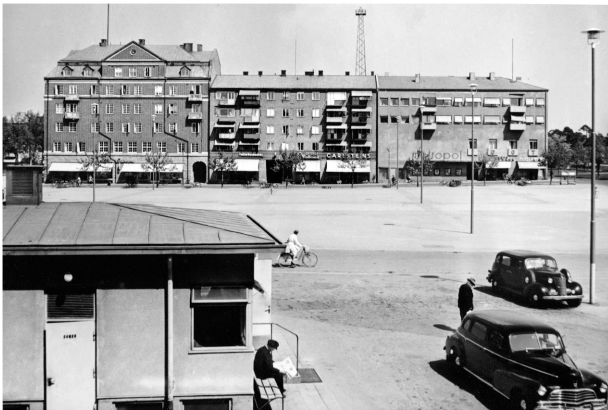
Drottningtorget med taxistationen år 1946. Bild nr TB-150-035, Innovatums bildarkiv.