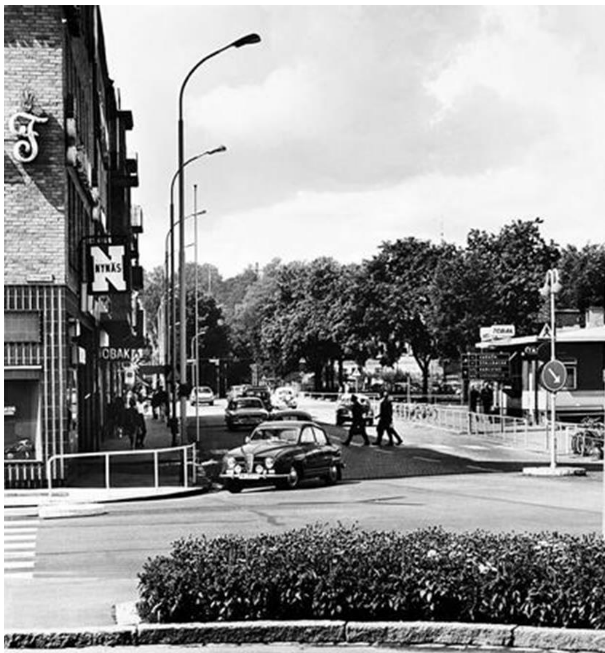
Nyströms hörna i korsningen av Drottninggatan och Torggatan. Foto Sven Stertman i juli 1968. Bild nr TB-301-003, Innovatums bildarkiv.