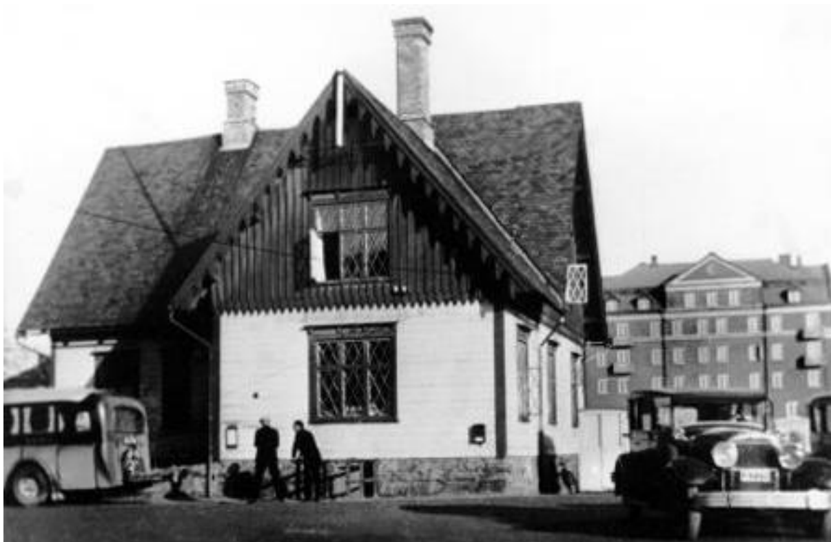
Flickslöjdskolan på Drottningtorget med telegraf- och telefonstationen i kvarteret Tor i bakgrunden. Bild nr TB-150-014.

Nedanstående bild är från början av 1930-talet.