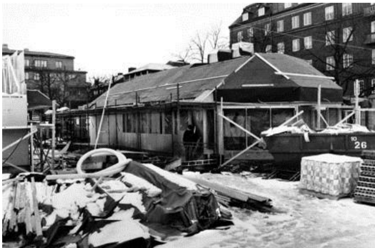
Ombyggnad av Drottningtorget i mars 1985. I bakgrunden till vänster kvarteret Diana och till höger kvarteret Tor.

Bild nr TB-150-112