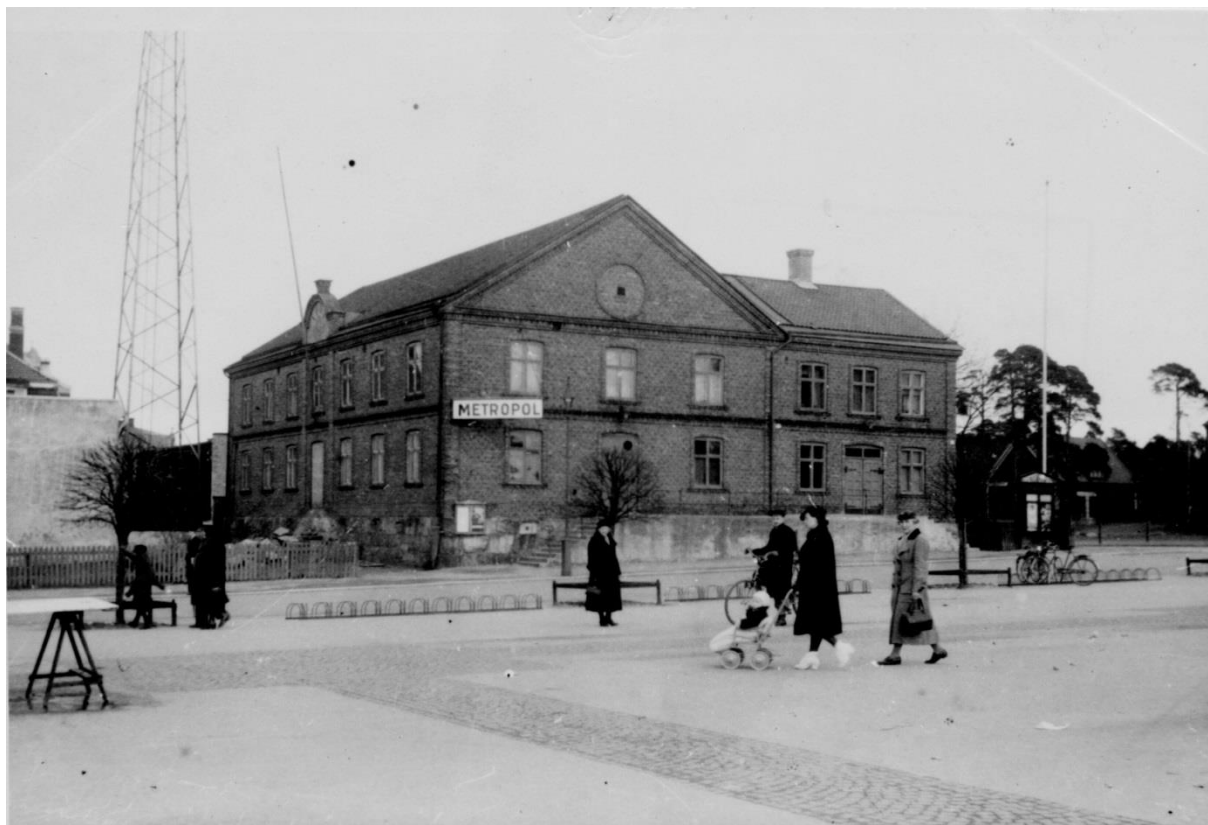
Kvarteret Tor vid Föreningsgatan sett från Drottningtorget år 1934. Bild nr TB-122-122.

Den första privatägda radiostationen i Trollhättan fanns i kvarteret Stormen. När Televerket hade övertagit radiostationen inrymdes den i kvarteret Tor 4.