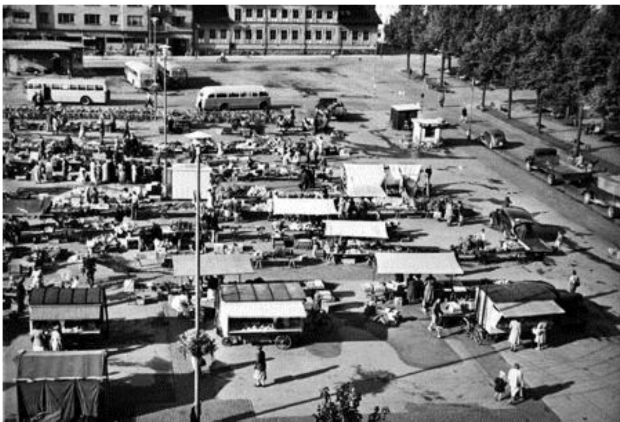
Marknad på Drottningtorget år 1950. Bild nr TB-150-044, Innovatums bildarkiv.