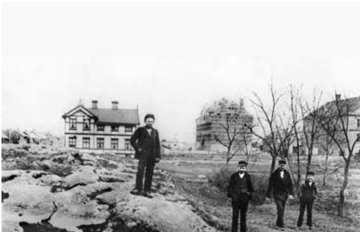
Drottningtorget med kvarteret Tor i bakgrunden år 1900. Från vänster Fischerströmska villan (byggd år 1899, blev senare Savoy) i hörnet av Föreningsgatan och Kungsgatan, Östra skolan (Odenskolan, som invigdes år 1896) och IOGT-huset (invigdes år 1895). Bild nr TB-150-001, Innovatums bildarkiv.