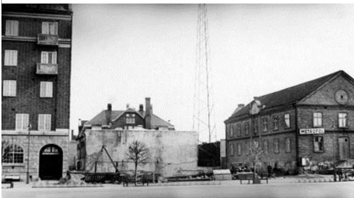
Kvarteret Tor vid Föreningsgatan sett från Drottningtorget år 1936. Till vänster telegraf- och telefonstationen och i mitten varmbadhuset. Bild nr TB-150-025, Innovatums bildarkiv.