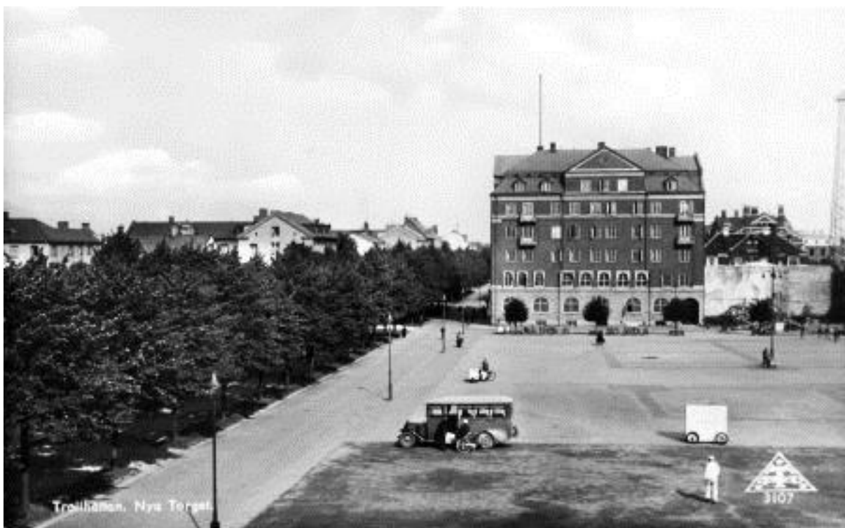
Vykort över Drottningtorget år 1932. I bakgrunden telegraf- och telefonstationen som stod färdig år 1917 i hörnet av Kungsgatan och Föreningsgatan med adress Kungsgatan 38. Bild nr TB-150-012, Innovatums bildarkiv.