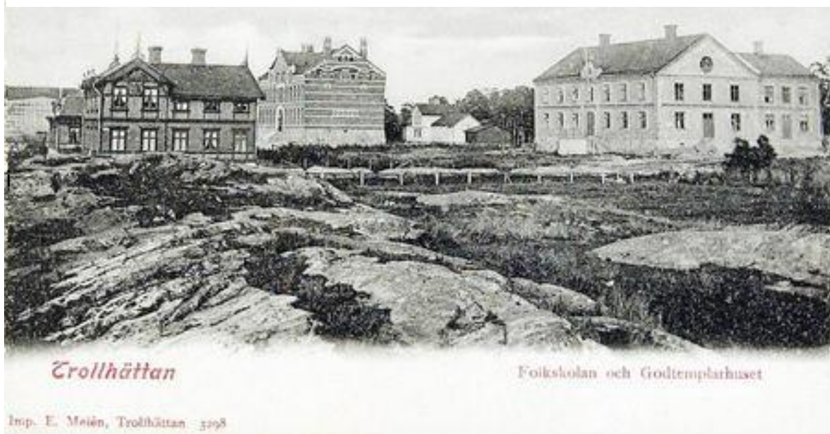
Samma plats som föregående bild ett år senare. Fotograf Elise Melén år 1901. Bild nr TB-146-018, Innovatums bildarkiv.