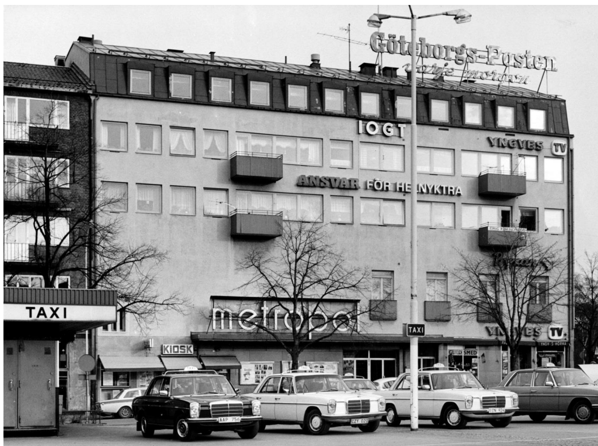
Föreningsgatan vid Drottningtorget år 1976 med kvarteret Tor i bakgrunden. Bild nr TB-122-126, Innovatums bildarkiv.