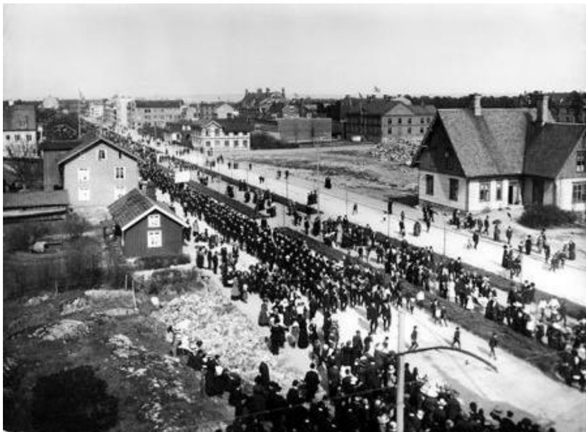
Första majdemonstration utmed Kungsgatan, när Drottningtorget håller på att ställas i ordning år 1913.

Bild nr TB-091-040