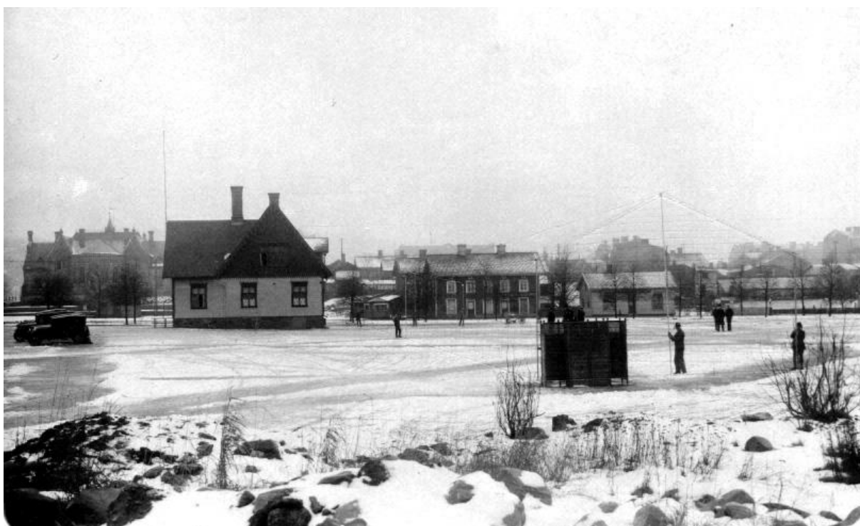
Östra delen av torget mot Kungsgatan med flickslöjdskolan till vänster. I bakgrunden kvarteren Polhem och Diana.