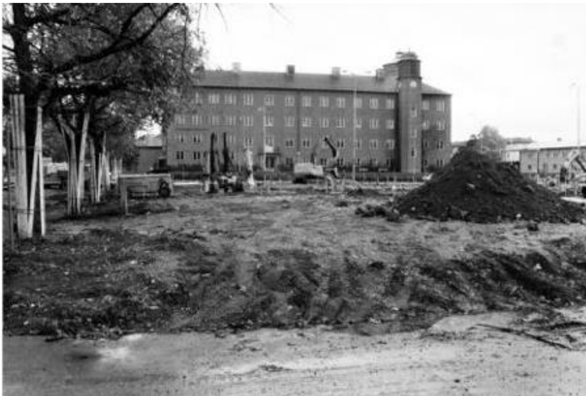
Ombyggnad av Drottningtorget i oktober 1984. I bakgrunden Polhemsgymnasiet.

Bild nr TB-150-112, Innovatums bildarkiv.