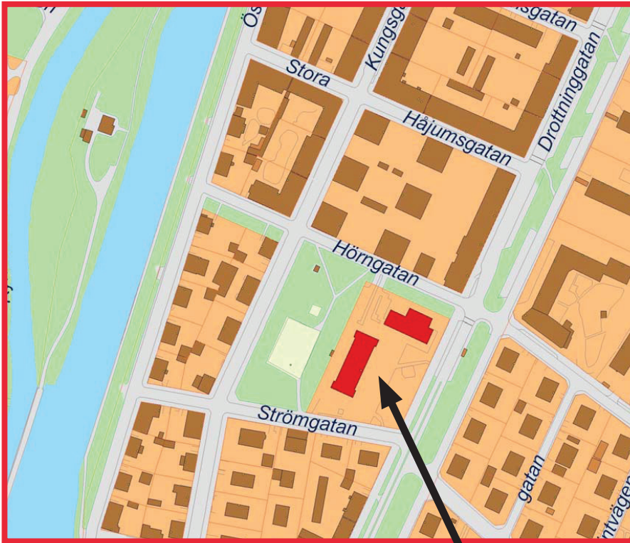
Strömgatan 8 (fd Oscarskolan)