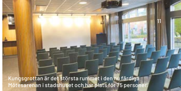
Kungsgrottan är det största rummet i den nu färdiga Mötesarenan i stadshuset och har plats för 75 personer.