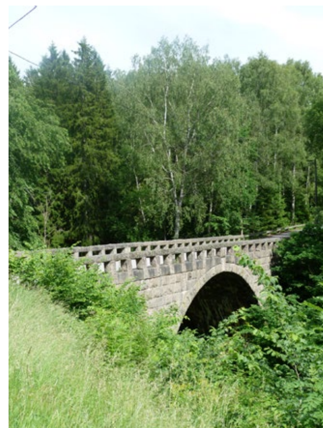
Hälltorpsbron är en stenalvsbro som uppfördes mellan 1925 -1927. Idag är bron registrerad som en kulturhistorisk lämning och representerar en teknik som visar på äldre tiders brobyggnation.

Hälltorpsbron leder över den ravin som går mellan Strömslund och Torsred. Bron uppfördes åren mellan 1925-1927 och utgör ett fint exempel på 1900-talets bruksmurade stenalvsbroar med en monumental inverkan på landskapet.