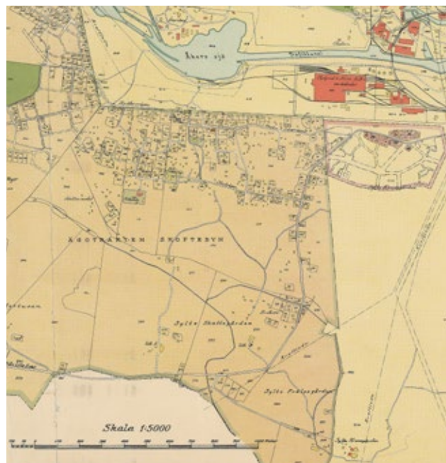
Stadskarta från 1933 som tydligt visar de olika gårdarnas ägor och hur Skoftebyn börjar ta form på Syltegårdarnas marker.

Stadsdelen är bebyggd med småhus uppdelade i tre tydliga kvarter och flerbostadshus i storgårdskvarter. Sylte är planerat och uppfört som en grannskapsenhet, ett planeringsideal som bland annat innebar att boende i områdena skulle ha närhet till matbutik, skola, kyrka och rekreationsområden. Sylte centrum utgör tillsammans med Sylteskolan med årskurserna f-9 en tidstypisk närcentrummiljö, placerad i stadsdelen mitt.