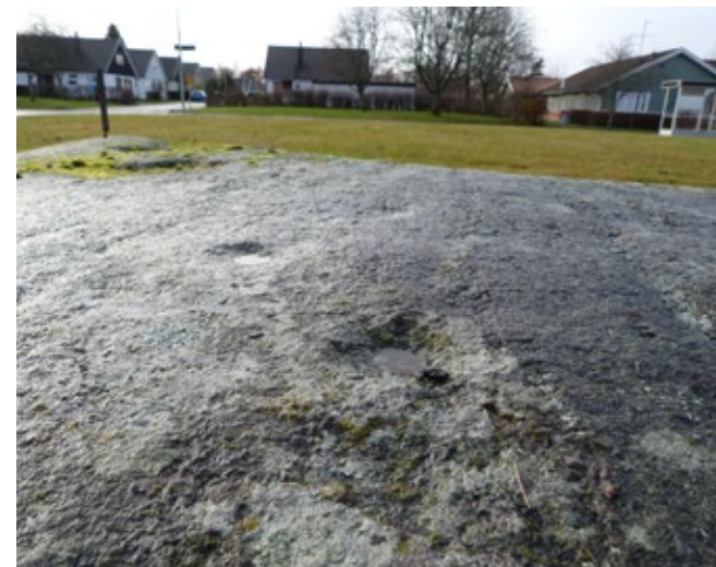
I den lilla parken Gökängen finns en välbevarad och synlig fornlämning i form av älvkvarnar eller s.k. skålgropar.

I stadsdelen finns ett antal fornlämningar som visar att området tidigt varit ett hem för människor. Lämningarna i området utgörs till stor del av fynd från sten-, brons- och järnåldern i form av fossil åkermark och hållristningar. I parken Gökängen finns lämningar av älvkvarnar eller s.k. skålgropar vilka härstammar från sten- eller bronsålder. Skålgroparna anses ha samband med forntida fruktbarhetskultur och odlingsmagi. I Offerhällsparken finns även lämningar i form av hållristningar.