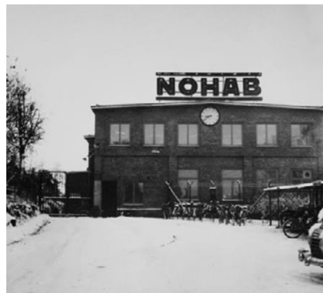
Byggnaden uppfördes som plåtslagerverkstad under slutet av 1890-talet. Under 1930-talet när produktionen ändrade inriktning byggdes det delvis om till kontor och laboratorium. Byggnadens välbevarade tegelfasad är det första som möter besökare till området. Äldre fotografi från 1955, Källa: Innovatum bildarkiv.