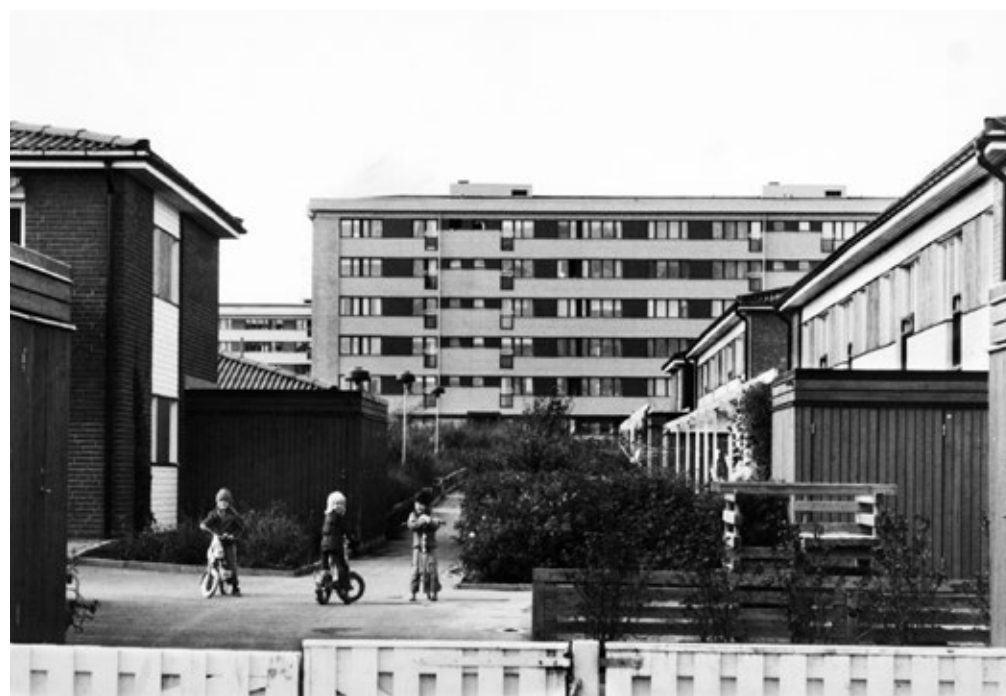
Bebyggelse i kv. Citronfjärilen åren 1978 och 2013. Skivhusens nästan monumentala inverkan på området och kontrasten mot de lägre radhusen är karakteristisk för miljön.