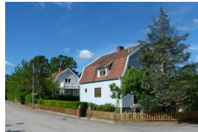
I Källstorp finns en blandad bebyggelse. Av den äldsta finns några få hus bevarade annars har mycket rivits till förmån för nya bostadsområden.