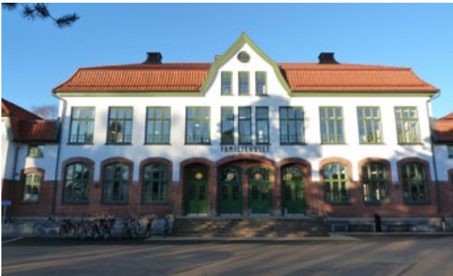
Ett exempel på den mer strama jugendarkitekturen finns i fd. Oscarsskolan numera Familjehemmet på fastigheten Folkskolan 1. Huset är ritat av Lars Kellman år 1909. Byggnaden är ett mycket fint exempel på arkitekturen.

Arkitekturen skiljer sig från de tidigare stilarna. Formerna på burspråk och frontespiser är mjukare. Fasaderna är dekorerade med raka linjer eller mjukt böljande ornamentik med växtmotiv. Socklarna är klädda i avvikande material och kulör mot resterande fasader. Fönstren är ofta indelade i två eller tre lugter med T-post där de övre rutorna är småspröjsade. Taktyperna är varierande men röd och grön falsad plåt är vanligt liksom glaserat tegel.