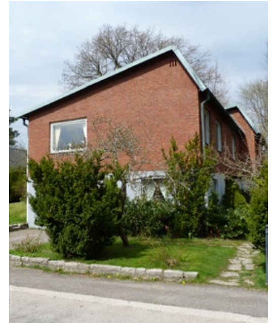
Det så kallade "trollhättetaket" är en taktyp som är särskilt vanligt i Trollhättan, både på flerbostadshus och på mindre en- och tvåfamiljshus. Taktypen var framför allt populär under 1950- och 60-talet.