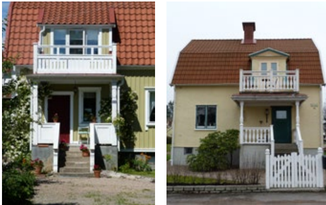
En öppen farstuvist med högre markerad sockel och ibland även balkong i våning två är utmärkande för egnahemmen under tidigt 1900-tal. Två exempel är Linden 3 i Strömslund och Slätterblomman 11 i Skoftebyn.

Under 1920-talet började det bli en politisk angelägenhet att bekämpa de bristande sanitära förhållandena i städerna för att minska den höga bostadsbristen, vilket resulterade i att egnahemsområden även bildades med kommunala och statliga medel. Egnahemsområdet i Hjulksvarn är ett bra exempel på detta.