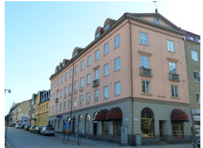
Detta bostadshus på fastigheten Mercurius 2 är uppfört runt 1926 efter ritningar av Allan Berglund. Huset är en fin representant för tidens arkitektur med många arkitektoniska detaljer som är karakteristiska för 1920-talets klassicism.

1920-talsklassicism följer ett mer klassiskt stilideal med släta fasader antingen putsade eller i tegel. Dekoren är sparsam med ornamentik hämtad från antikens arkitektur i form av medaljonger, pilastrar och listverk. Fönstren följer en symmetrisk sättnings med två lugter med tre rutor i varje båge. Taken är oftast flackare sadeltak belagt med varierande takmaterial så som skiffer, tegel eller falsad plåt.