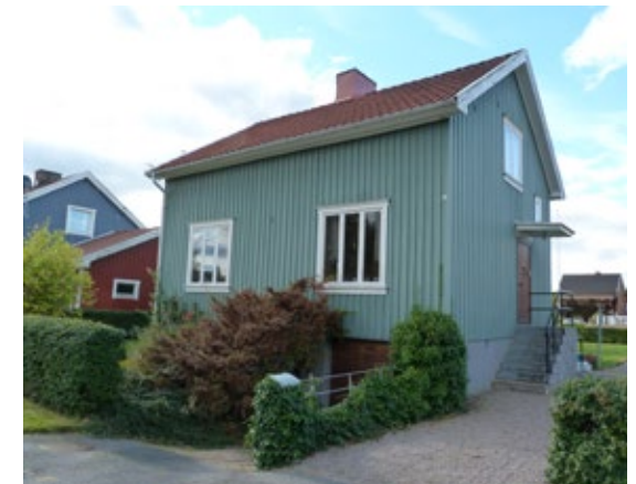
Ett egnahem kan se ut på många olika sätt beroende på när det är uppfört. I Trollhättans finns många fina exempel på byggnadstypen. Från vänster syns Grosshandlaren 3, Basen 4, Sälgen 2, Doppingen 11.