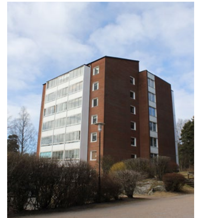
Punkthus i kvarteret Läkaren i Karlstorp.

Punkthusen uppfördes oftast som stadsdelsmarkörer för nya bostadsområden eller för att skapa variation i stadsbilden. Hustypen karakteriseras av dess form som kommer av det centralt placerade trapphuset vilket kunde ge en hög byggnad på liten yta. Husen var lätta att placera och lämpade sig särskilt väl för kuperad terräng. Punkthusen längs Lantmannavägen är numera direkt förknippade med Kronogården och utgör en viktig markör för stadsdelen. Punkthus med karakteristisk placering och utformning finns även i Karlstorp utmed Karlstorpsvägen.