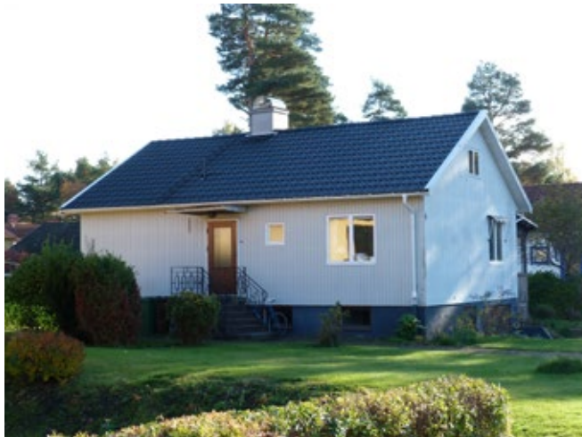
Gärdsmygen 8 ett mycket tidstypiskt kataloghus från BoroHus, uppfört år 1953.

Trädgårdens syfte ändrades från att tidigare främst använts för odling och småjordbruk till en plats för rekreation och prydnad. Husen placerades några meter in på tomten så att två trädgårdar bildades, en social och synlig mot vägen och en privatare på baksidan oftast med uteplats i nära anslutning till vardagsrummet.