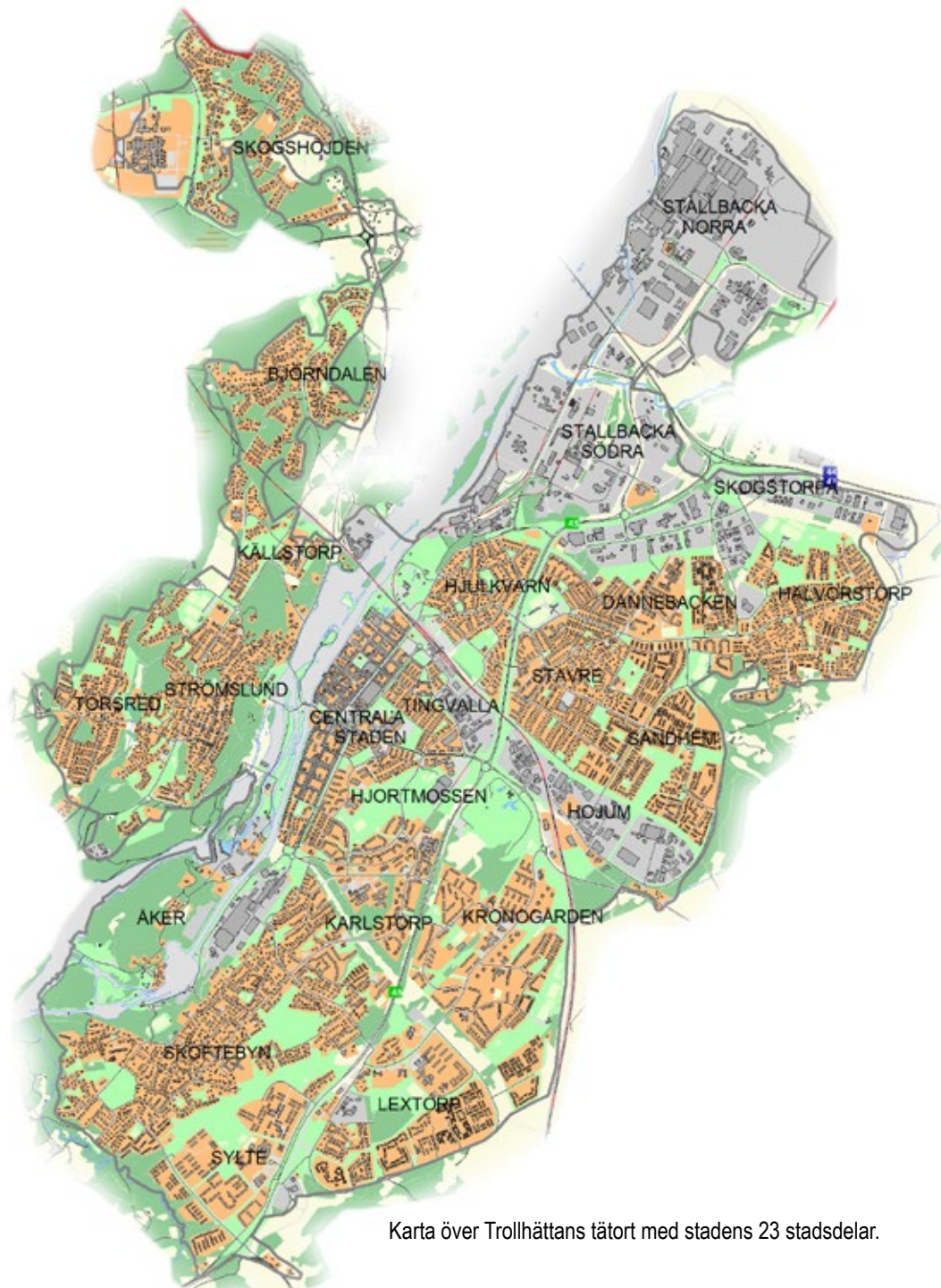
Karta över Trollhättans tätort med stadens 23 stadsdelar.