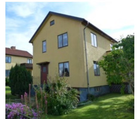
Funktionalismens arkitektur präglas av en enkelhet. Fönsterband, dekorativt utformade järnräcken, balkonger över hörn och rundande burspråk är karakteristiska detaljer. Bostadshusen på fastigheterna Fagerskog 4, Bredablick 5, Gullön 8, Eken 7 och Spoven 4 är uppförda i en utpräglad funktionalistisk arkitektur mellan 1930-1945.