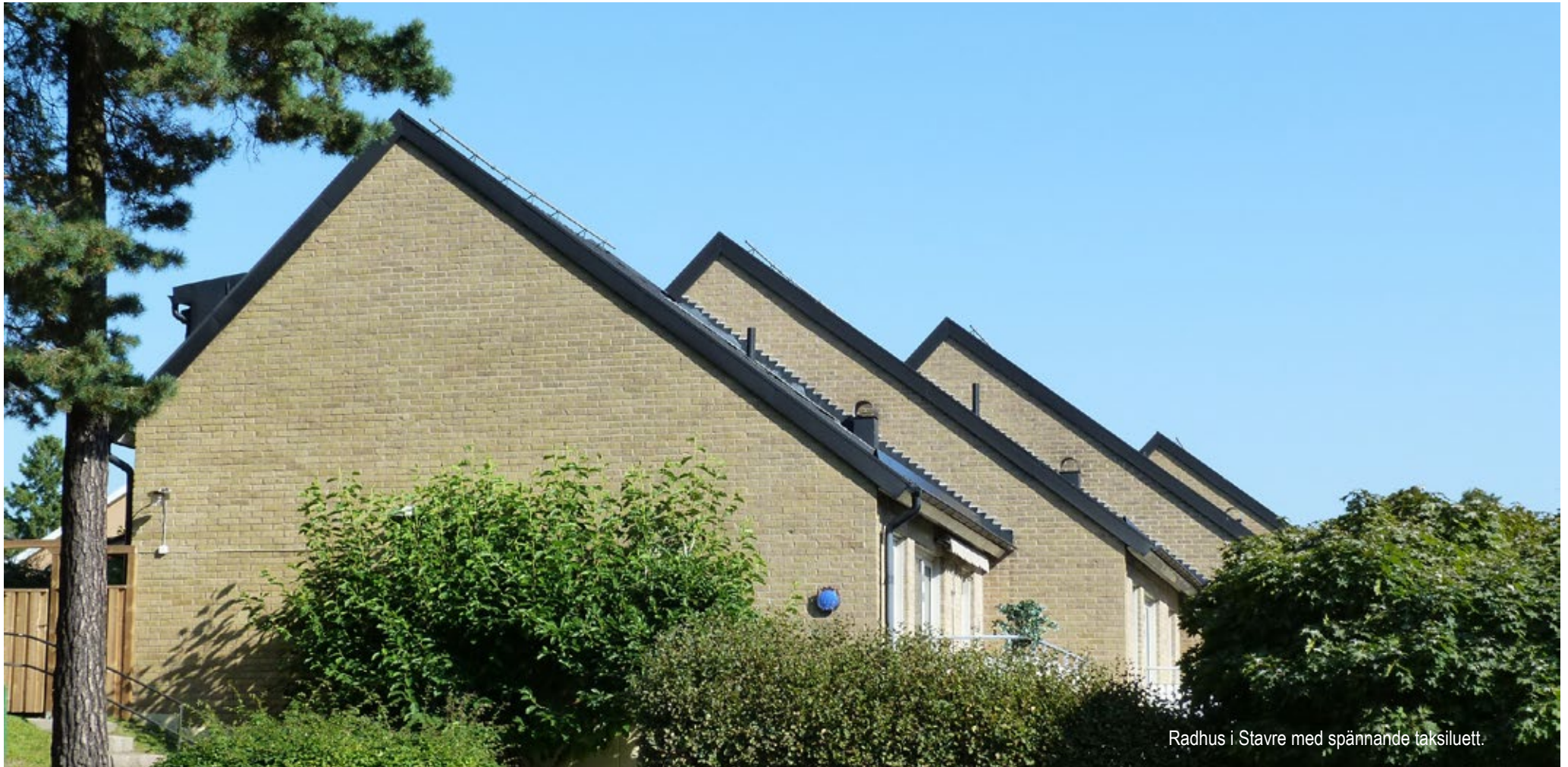
Radhus i Stavre med spännande taksiluet.

På följande sidor presenteras 22 stadsdelar i Trollhättans tätort. I nästan varje stadsdel finns kulturmiljöer som på olika sätt synliggör människans avtryck i historien. Sociala, estetiska och kulturhistoriska värden vägs samman och beskriver miljön och dess värde för ett framtida bevarande.