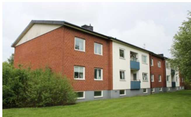
Lamellhus av olika typer finner man bland annat i kvarteret Krubban och Höskrindan i Kronogården.