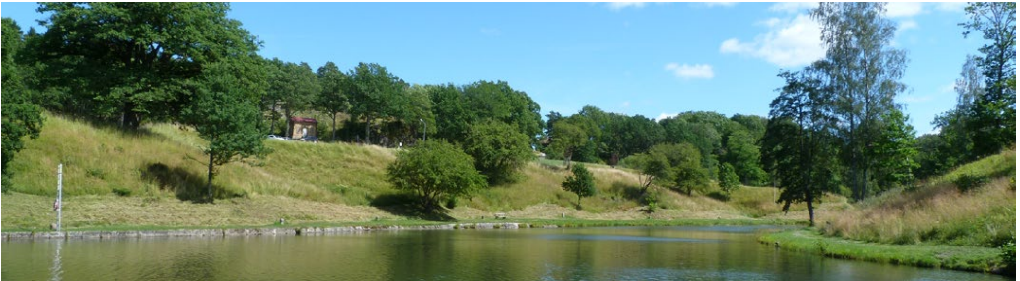
Kanal- och slussområdet är skyddat som byggnadsminne och utgör även riksintresseområde för kulturmiljövården. Platsen har en lång historia och är en mycket värdefull del av Trollhättans historia.

Trollhättans tidigare kulturmiljöprogram antogs 1992. Sedan dess har synen på vad som är kulturhistoriskt intressant och värdefullt ändrats och tidsgränser flyttats fram. Därför har behovet av ett underlag som berör den sentida bebyggelsen och hur staden ska arbeta med dessa miljöer uppstått. I kulturmiljöprogrammet redovisas 48 kulturmiljöer inom Trollhättans tätort som är värdefulla för vår gemensamma kulturhistoria. Programmet är en vägledande produkt för hur staden ska hantera och utveckla sina kulturmiljöer.