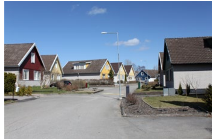
Kedjehus i kvarteret Svartmyran från 1972.

Småhusen uppfördes dels som en motreaktion till de enformiga lamellerna och dels för att skapa varierade boendeformer i stadsdelarna. Småhusen placerades oftast i ytterkanterna av bostadsområdena som en mjukare övergång till de öppna landskapen. I Trollhättan finns en stor andel gruppvis placerade kedje- och radhus från denna tid, placerade i storgårdskvarter med trafikseparerade gårdar. Denna typ av massproduktion av småhus som i stort sett bara "rullades ut" på flacka marker kom att kallas för villamattor. En tredjedel av alla hus som uppfördes under rekordåren var småhus av olika typer.