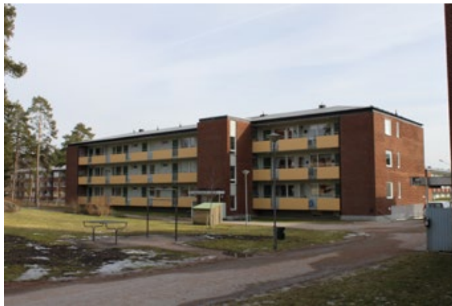
I kvarteret Biet finns Trollhättans enda loftgångshus från rekordåren.

Loftgångshusen blev populära under andra halvan av 1960-talet och har utanpåliggande loft men i övrigt oftast lika volym och byggnadskropp som ett lamellhus. De var, liksom många av hustyperna som uppfördes under miljonprogrammet, ekonomiska. En enda hissordning kunde, genom de karakteristiska loftgångarna, betjäna fler lägenheter än i ett vanligt lamellhus. Detta medförde även att hustypen fick en särpräglad arkitektur som är mycket karakteristisk för miljonprogrammets bebyggelse. I kvarteret Biet finns Trollhättans enda loftgångshus från rekordåren.