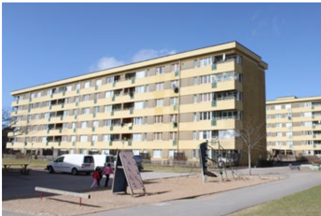
Skivhusen i Lextorp och punkthusen längs Lantmannavägen i Kronogården utmärker sig genom byggnadsvolym och placering.

Skivhus är ett lamellhus högre än fem våningar. Under början av miljonprogrammet uppfördes höga skivhus upp till 13 våningar men planerare och boende i miljön märkte snabbt att hustypen skuggade stora områden och man valde i många städer därför att uppföra lägre skivhus med enbart sju våningar. I Lextorp finns karakteristiska skivhus i Guldvingen 2, placerade i samma riktning, med öppna gemensamma gårdar.