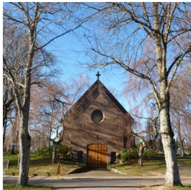
Metakapellet från 1916 i välbevarad nationalromantisk tegelarkitektur.

Utöver dessa finns även olika typer av askgravar. De senaste är askgravslunden i områdets södra del där det finns möjlighet för att sprida askan efter ordnande former. En plats har utformats med hjälp av stenkonstnären Lolo Funck Andersson. Inom området finns även tre områden för muslimska gravsättningar. Den första anlades under 1980-talet och de två senare år 1990. Samtliga gravar inom de muslimska kvarteren är orienterade i väst-östlig riktning.