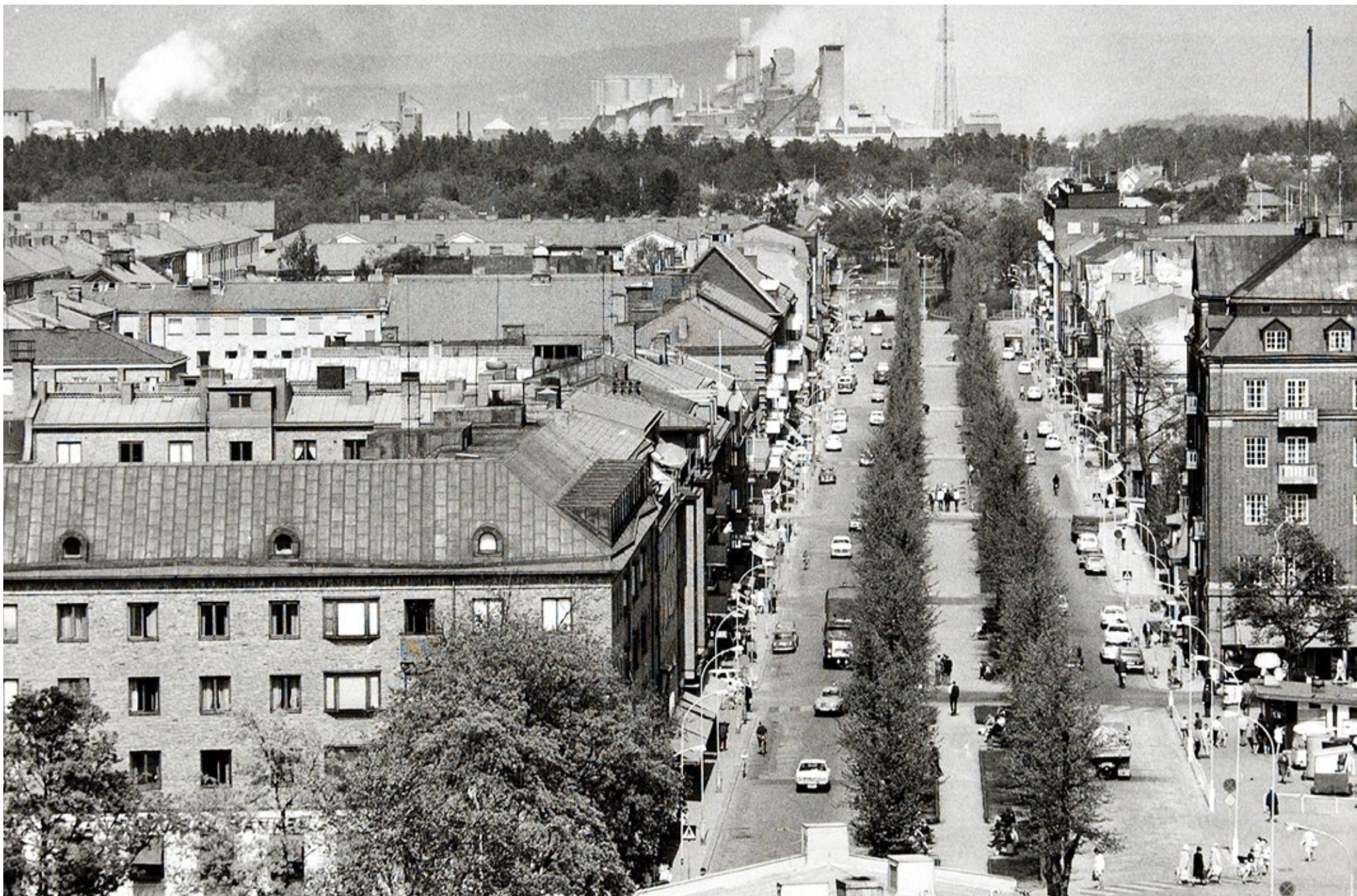
Vy över Kungsgatan åt norr med industrierna på Stallbacka i bakgrunden.