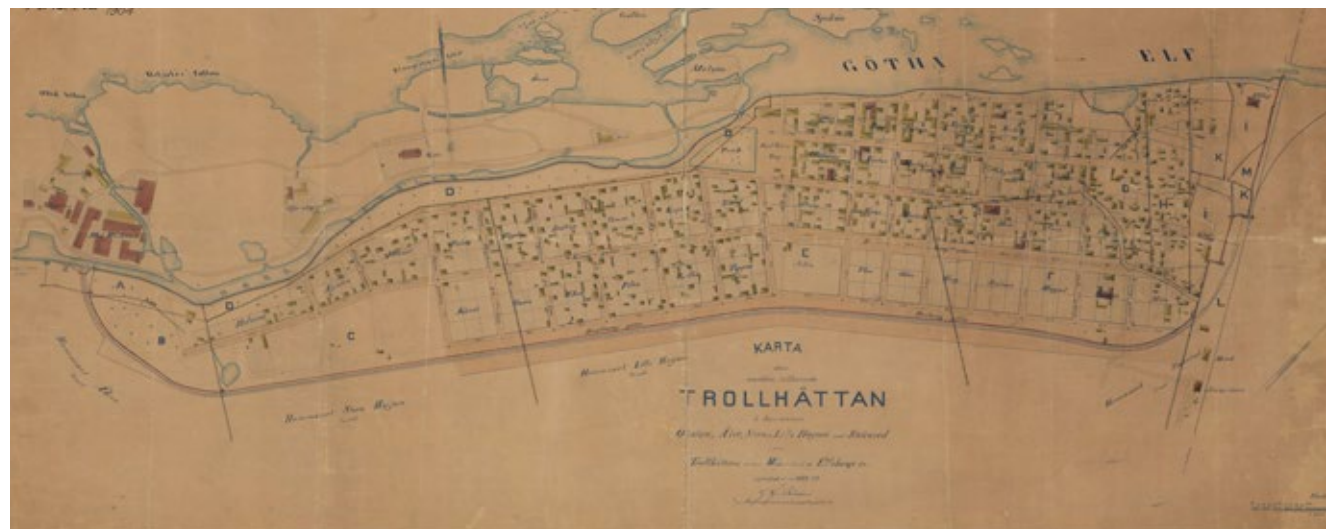
Utsnitt från 1794 års karta över Trollhättan. År 1863 upprättas den stadsplan som till stora delar fortfarande gäller för centrala staden.