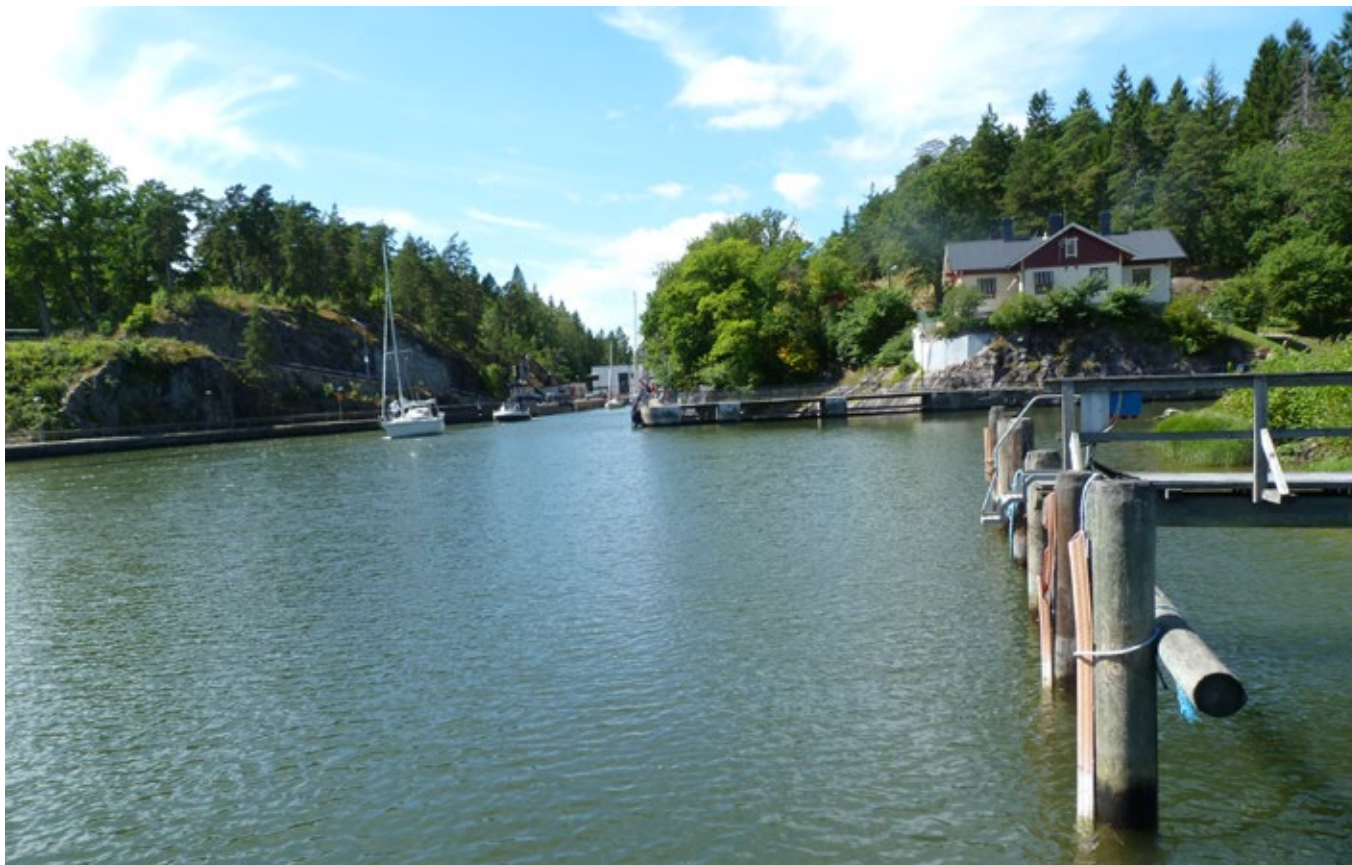
Vy över 1916 års slussled, med mötesbassängen i förgrunden och bostadshus till höger i bild.

Den samlade miljön med verkstadsbyggnader, bostadshus, slussar och natur- och kulturlandskap utgör en mycket speciell miljö där en industriell utveckling och ett liv vid slussarna synliggörs.