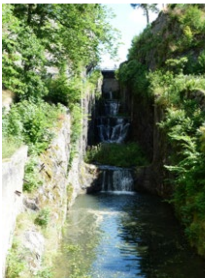
Slussleder från åren 1800, 1844 och 1916.

Området och älven började utvecklas för att behöva bättre farleder mellan Sveriges inland och kusten ökade. Markerna tillhörde då jordbruksfastigheten Åker som finns omnämnt