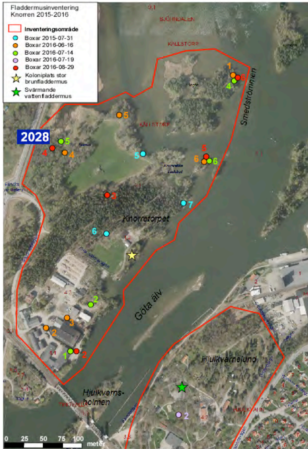
Karta 1. Inventeringen har innefattat Knorren, Långön och Folkets Park samt Stridsberg, söder om Knorren. Autoboxarnas placering och numrering vid respektive inventeringstillfälle framgår av kartan. Även en koloniplats för större brunfladdermus och svärming av vattenfladdermus framgår av kartan.