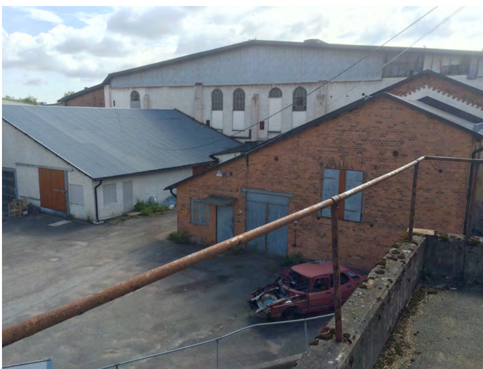
Äldre byggnader, som vid Stridsberg, kan användas både som vilo- och yngelplatser.