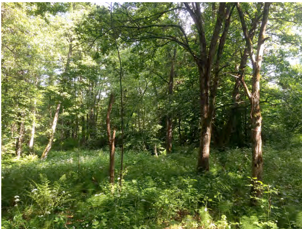
Vissa arter jagar i luckig lövskog, som i Knorrenområdets nordvästra del, mellan väg 2028 och de stora gräsplanerna i norr.