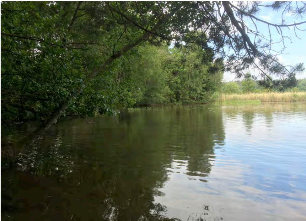
Strandnära lövskog finns på flera platser i inventeringsområdet och är en viktig miljö för fladdermöss.

Fladdermöss gynnas av variationsrika miljöer där det både finns hög insektsproduktion och tillgång till vilo- och yngelplatser. Området kring Göta älv erbjuder många olika slags jaktmiljöer genom den öppna vattenspegeln, dess flikiga lövskogsbevuxna stränder, vikar, öar och sund samt sydvända bryn och öppna till halvöppna ytor i kombination med lövträd. Fladdermusfaunan gynnas även av mängden lövträd samt förekomsten av hålträd och träd med släppande bark som kan fungera som koloni- och dagviloplatser. Även äldre byggnader kan användas på liknande sätt. Ensartade miljöer som barrskogar och stora skötta gräsytor har däremot generellt mindre betydelse för fladdermusfaunan. Vissa arter undviker dessutom upplysta områden medan andra tvärtom söker sig till gatlyktor i jakt på insekter som lockats av ljuset.