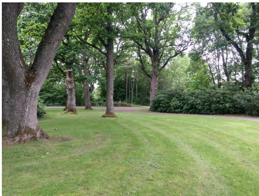
Svärmande vattenfladdermöss påträffades kring en grupp ekar i Folkets Park.