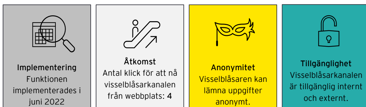
Figur 1: Visselblåsarfunktionens egenskaper

Information om visseblåsarsystemet har gått ut via intranätet och till chefer. Visselblåsarfunktionen finns tillgänglig på kommunens hemsida både för interna och externa parter. Samtliga visseblåsningar är anonyma såvida inte uppgiftslämnare frivilligt väljer att uppge sin identitet. Det finns en länk till visseblåsarfunktionen både på den externa hemsidan och via intranätet. Där återfinns även telefonnummer eller adress om visseblåsaren skulle vilja lämna sin rapport via telefon eller genom ett fysiskt möte.