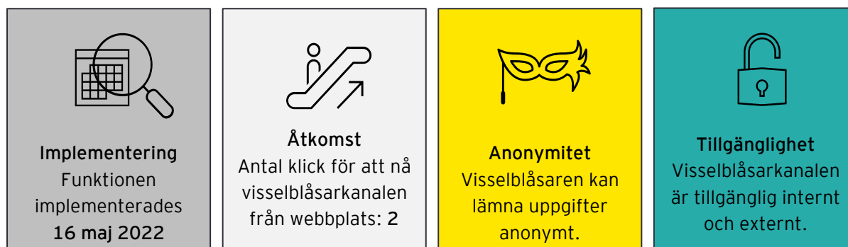
Figur 1: Visselblåsarfunktionens egenskaper

Visselblåsarfunktionen finns tillgänglig på Kraftstadens webbsida, både för interna och externa parter. Utöver webbsidan kan anställda även ringa eller lämna en visselblåsarrapport via ett personligt möte. Samtliga visselblåsningar är anonyma såvida inte uppgiftslämnare frivilligt väljer att uppge sin identitet.