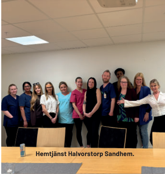
Hemtjänst Halvorstorp Sandhem.