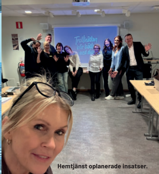
Hemtjänst oplanerade insatser.