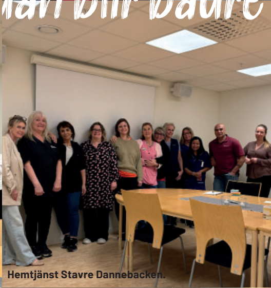
Hemtjänst Stavre Dannebacken.