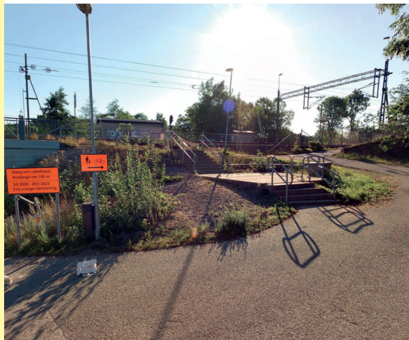
Så här blev resultatet. Mer blommor och mer grönska utlovas när årstiden är rätt.