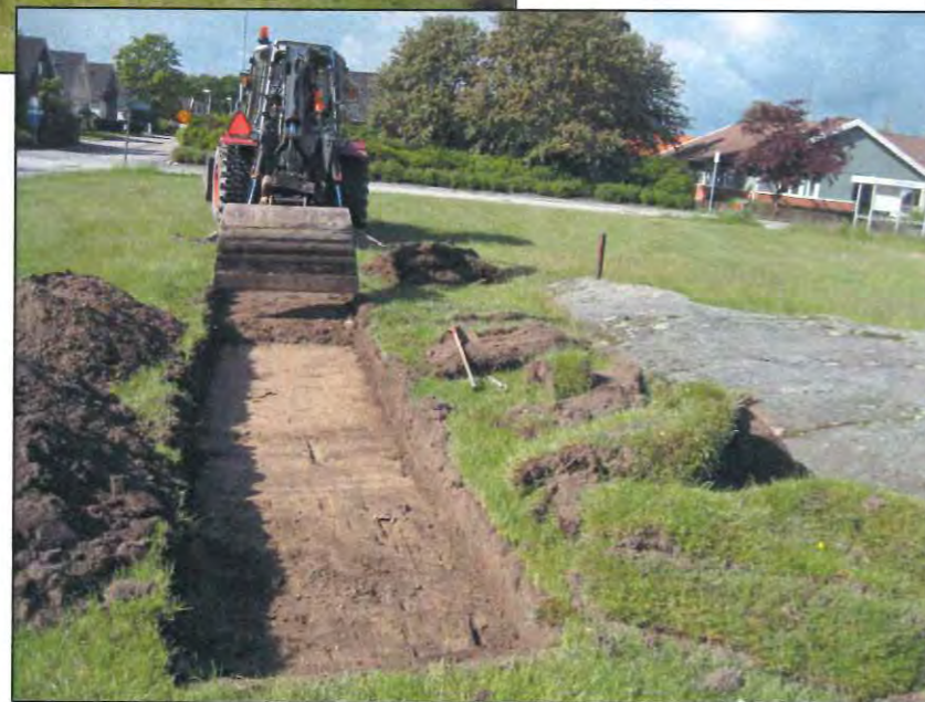
Foton som visar schaktade ytor inom undersökningsområdet