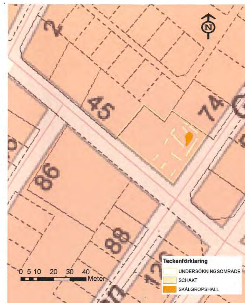
Karta över undersökningsområdet med skålgropshällen och samtliga schakt

Med hjälp av grävmaskin utrustad med planeringskopa grävdes sammanlagt 11 schakt med en total yta av ca 110 m 2 inom det aktuella förundersökningsområdet. Syftet var att upptäcka eventuella anläggningar, kulturlager eller andra strukturer. Schakten samt hällen med skålgroparna mättes in med GPS ansluten till Lantmäteriets RTK-tjänst med en noggrannhet på någon centimeter. Mätningarna kompletterades med manuella beskrivningar och fotografering med digitalkamera. Hela förundersökningsytan betraktades som intensiv.