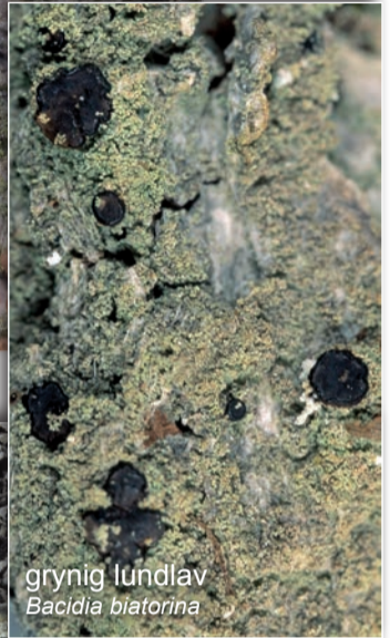
gryinig lundlav Bacidia biatorina