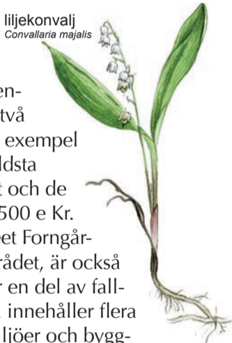
liljekonvalj Convallaria majalis

I fall- och slussområdet finns ett samarbete mellan olika verksamheter. Detta skall leda till att bevara och utveckla områdets natur och kulturhistoriska värden tillsammans med modern drift av kanalsjöfart och vattenkraftproduktion. Naturreseptatet är en av frukterna av detta samarbete.