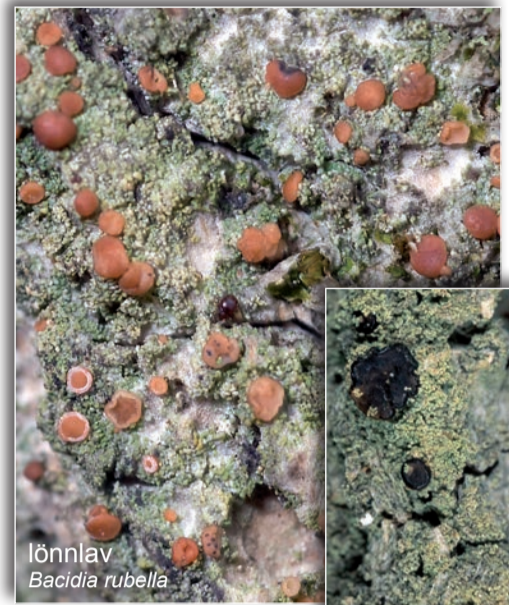
lönnlav Bacidia rubella

intressanta lavar och svampar. I branterna vid Kopparklinten förekommer till exempel västlig knotterlav Trapeliopsis wallrothii , som här har sin enda kända svenska förekomst. På äldre ekar växer oxtungsvamp Fistulina hepatica , lönnlav Bacidia rubella och gryinig lundlav Bacidia biatorina .