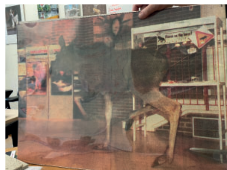
Bildbeviset på älgan som sprang in i foajén.