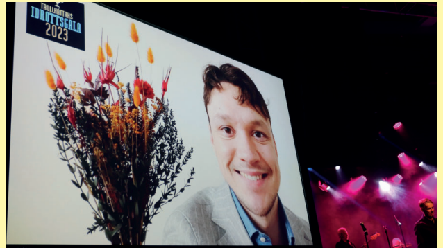
Nils van der Poel närvarade inte fysiskt på idrottsgalan, men skickade en videohälsning där han bland annat tackade Trollhättans Stad för de fina arenorna och anläggningarna som möjliggjorde hans idrottskarriär.

Fler bilder på vinnarna på Trollhättans Stads hemsida.