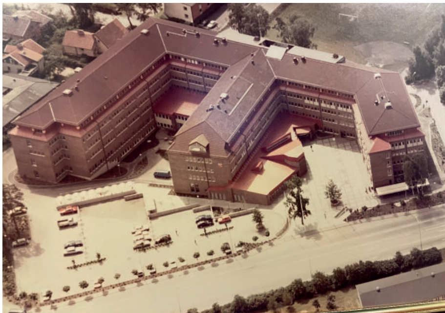
Nytagen bild från 1981 när stadshuset var nybyggt.

Genom en återbruksfunktion kan man också avskilja värmen från den luft som kommer tillbaka efter en vända i huset och koppla på den nya luften.