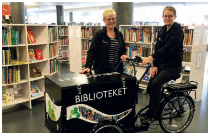
Biblioteket är inte ute och cyklar. Läs mer på sidan 4.