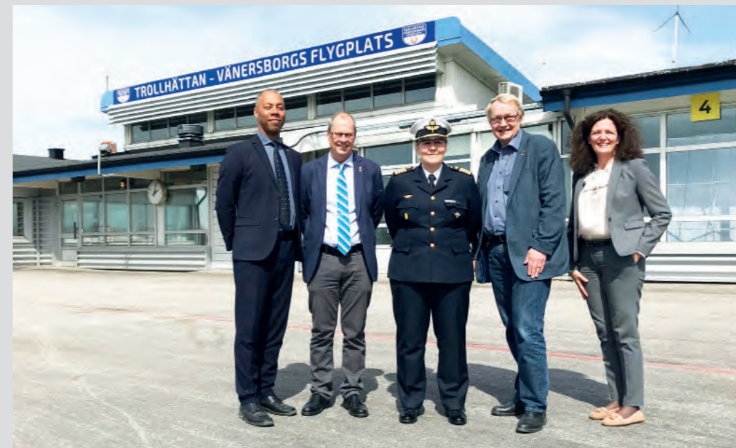
17 maj: Representanter för Vänersborgs kommun, Skaraborgs flygflottill och Trollhättans Stad träffas på Trollhättan-Vänersborgs flygplats och undertecknar en avsiktsförklaring. Samarbetet handlar om hur man tillsammans kan planera och utveckla totalförsvaret.

Det händer så otroligt mycket i våra verksamheter, långt mer än vad vi har möjlighet att berätta om i Stadsporten. Exempelvis gör vi ungefär 10–15 inlägg i veckan på Trollhättans Stads Facebook. Här följer ett axplock från de senaste veckornas publiceringar: