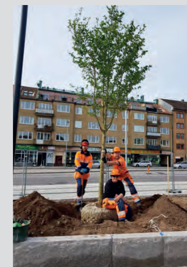
16 maj: De första träden planteras på torget.