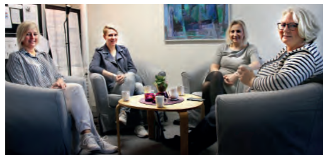
De samverkar för elevernas bästa. Läs mer på sidan 13.