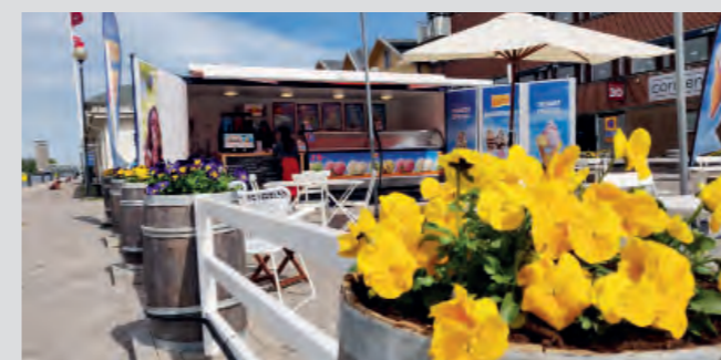
25 maj: Delar av Strandgatan har blivit gångfartsgata till fördel för sköna sommarpromenader och gott häng.