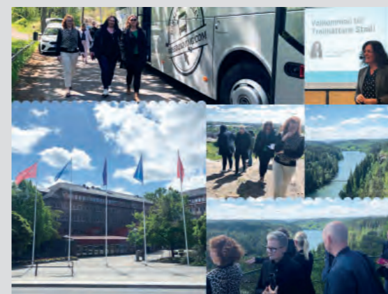
28 maj: introduktion för nya medarbetare. Dagen avslutas med en uppskattad busstur till flera av Trollhättans många smultronställen.